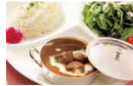
ヴィクトリアンカレー