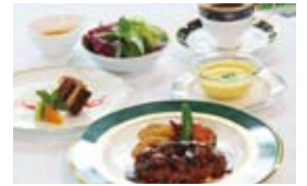
ハンバーグコース