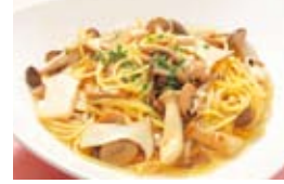
魚介類のスープパスタ