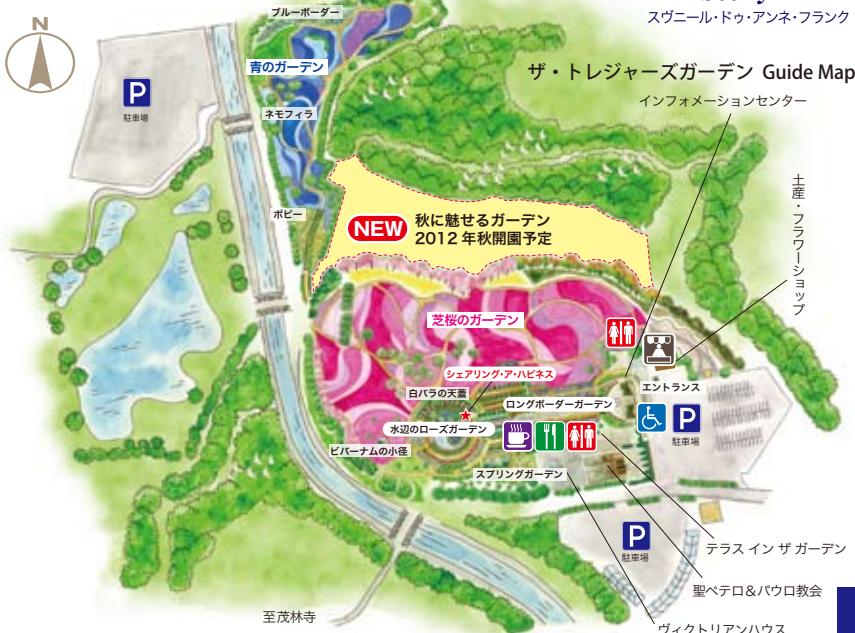
ザ・トレジャーズガーデン Guide Map インフォメーションセンター

「ザ・トレジャーズガーデン」は、群馬県館林市にある分福茶釜の伝説で有名な茂林寺や数多くの野鳥が生息する広大な野鳥の森に囲まれています。約80,000㎡の園内にある「芝桜のガーデン」では、4月上旬から25万株の赤・白・ピンク系の芝桜が開花し、「青のガーデン」ではネモフィラなどの22万株の花々が美しく咲き誇り、訪れる人々をやさしく迎えています。新設された石造りのエントランスは「幸せになれるバラの園」のプロローグ。延べ1000m超の「ロングボーダーガーデン」とブルーローズが美しい「水辺のローズガーデン」には、心を癒す7つのシーンと7つのバラの物語が展開されています。ぜひ一度足をお運び下さい。