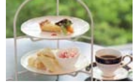
アフタヌーンティーセット