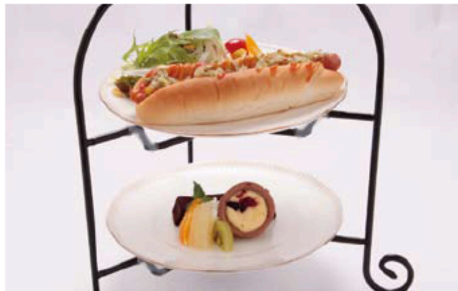
ホットドッグ&スイーツ(ドリンク付) 1,300円