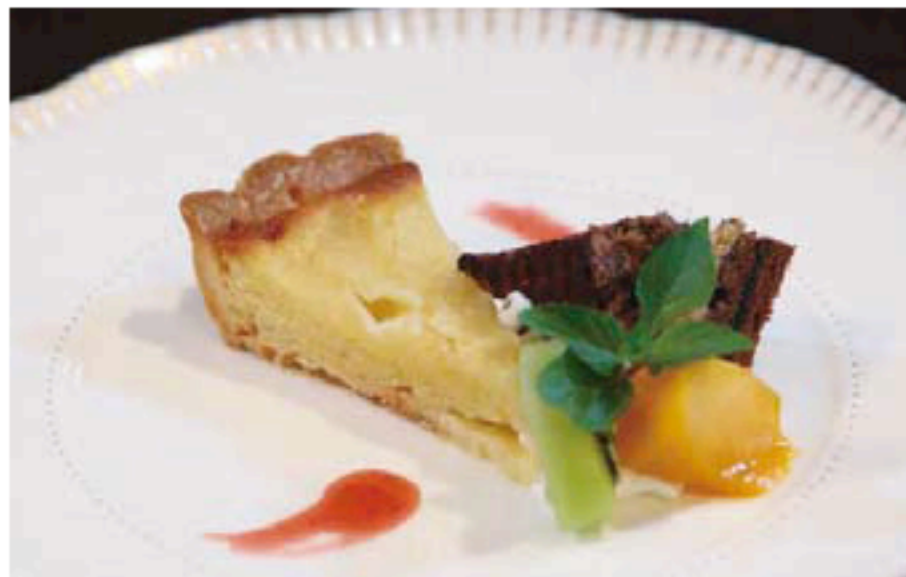
ヴィクトリアンスイーツ 単品 600円