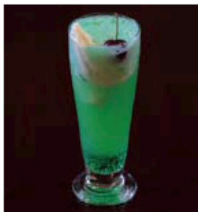
クリームソーダ 450円