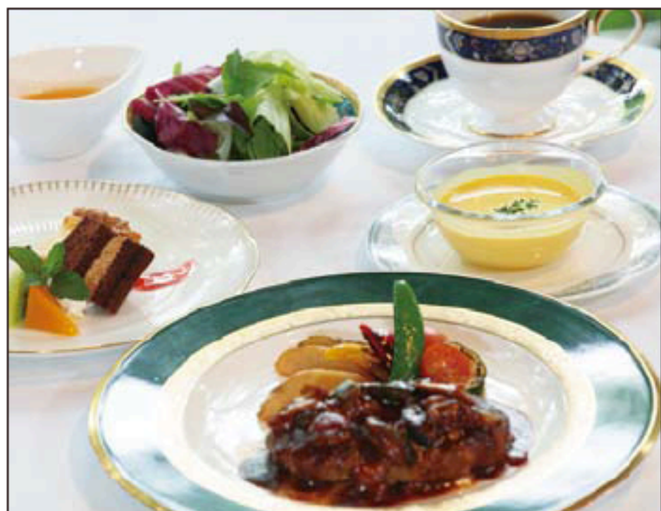
ハンバーグコース 2,000円

スープ サラダ ハンバーグステーキ ライスまたはパン デザート コーヒーor紅茶