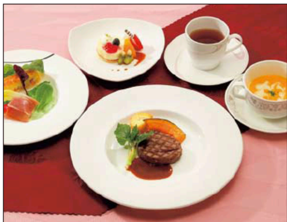
ビアンド(肉)コース 2,500円