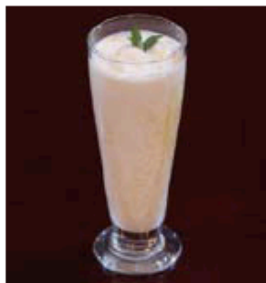
ロイヤルマンゴーシェイク 450円