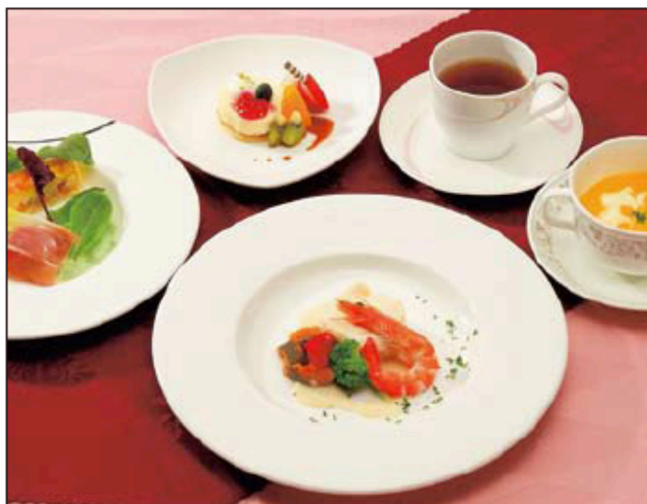
ポアソン(魚)コース 2,000円

スープ サラダ ハンバーグステーキ ライスまたはパン デザート コーヒーor紅茶